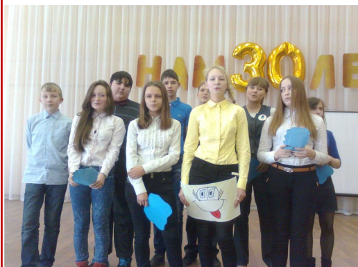
Hier sind einige Fotos aus dem Festival der Künste.

Dieser Festival wurde dem Jubiläum der Schule gewidmet.